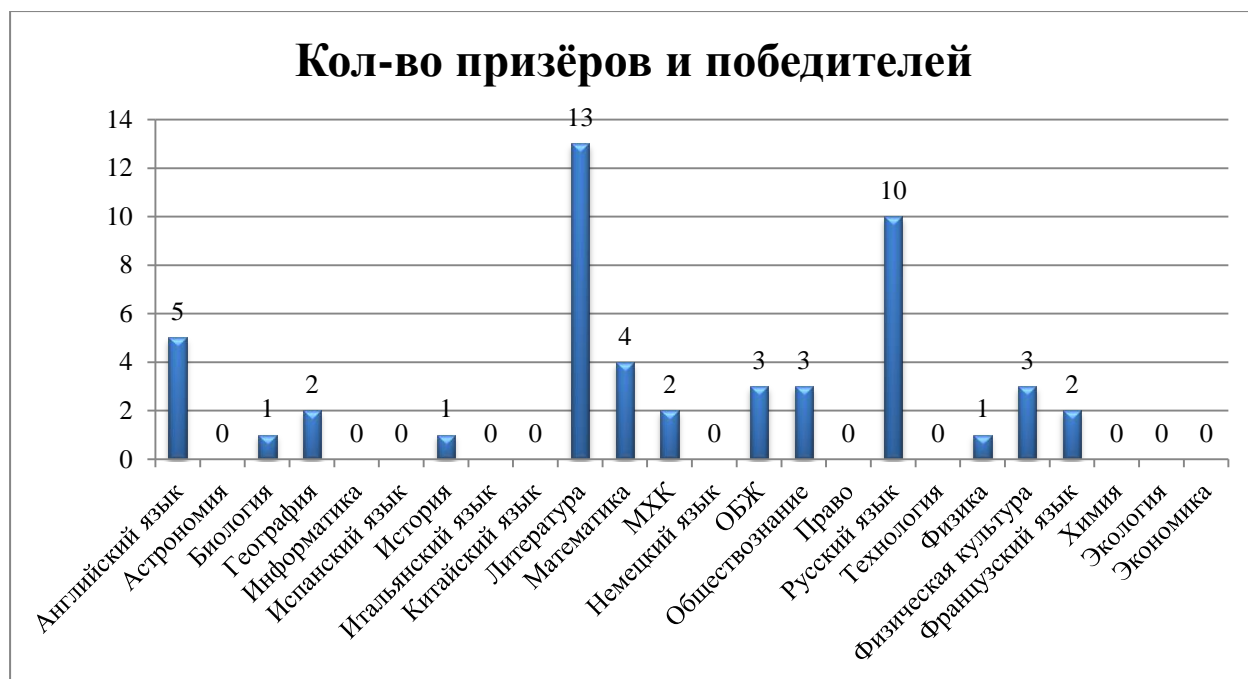
Диаграмма показывает, что самый большой интерес учащиеся проявляют к таким предметам как математика, обществознание, ОБЖ, физическая культура, что в целом говорит о разносторонней направленности учащихся нашей школы.

Дистанционные формы работы с учащимися, создание условий для проявления их познавательной активности позволили принимать активное участие в дистанционных олимпиадах регионального, всероссийского уровней. Результат – положительная динамика участия в олимпиадах, привлечение к участию в интеллектуальных соревнованиях большего количества обучающихся школы.